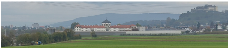
Établissement pénitentiaire de Lenzbourg

5 prisons de district : Aarau (2 sites), Baden, Kulm et Zofingen, avec un total de 137 places. Fondation Satis Seon : 90 places d'hébergement et de travail pour les personnes en régime ouvert pour l'exécution des mesures.