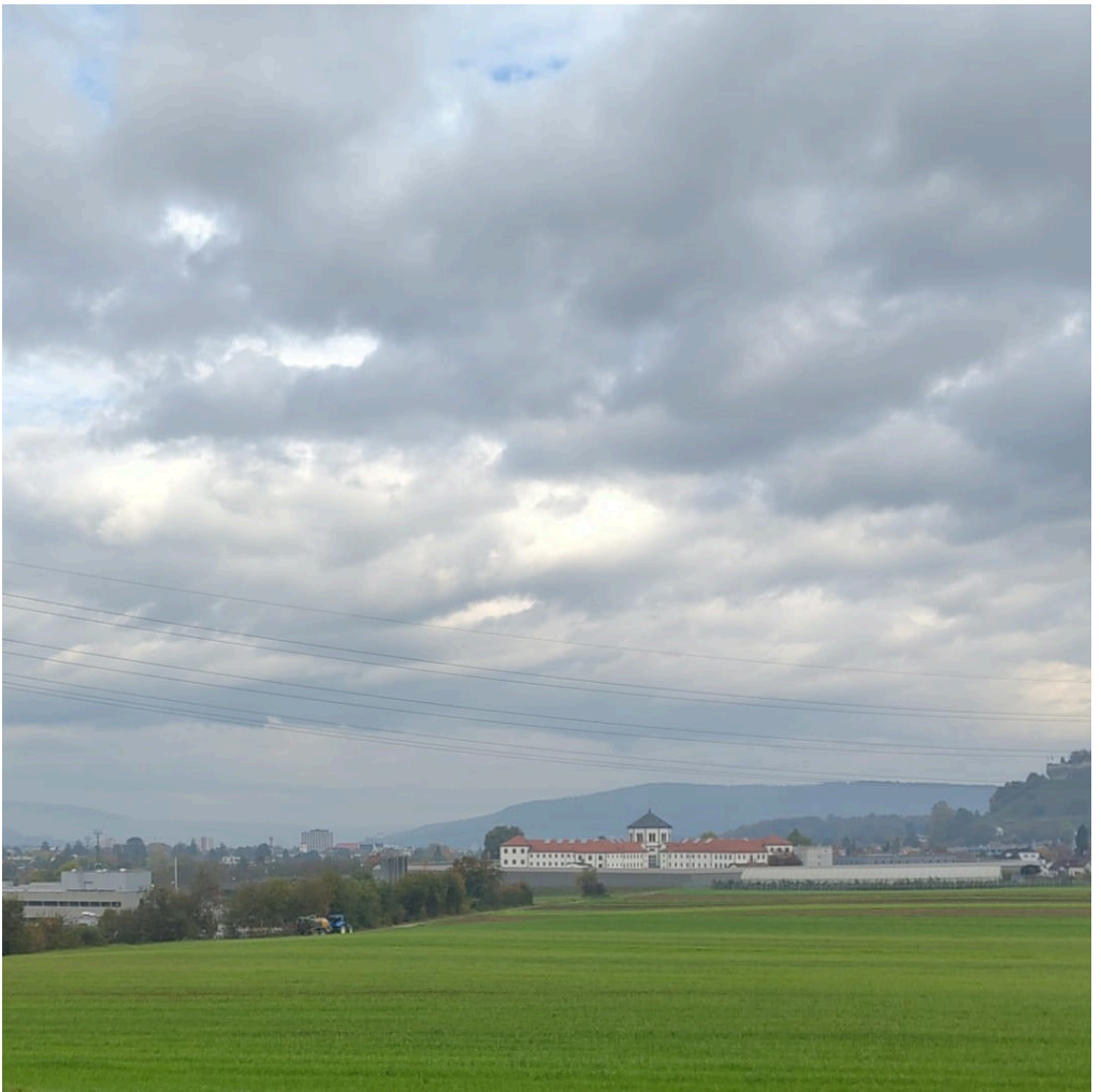
Établissement pénitentiaire de Lenzbourg