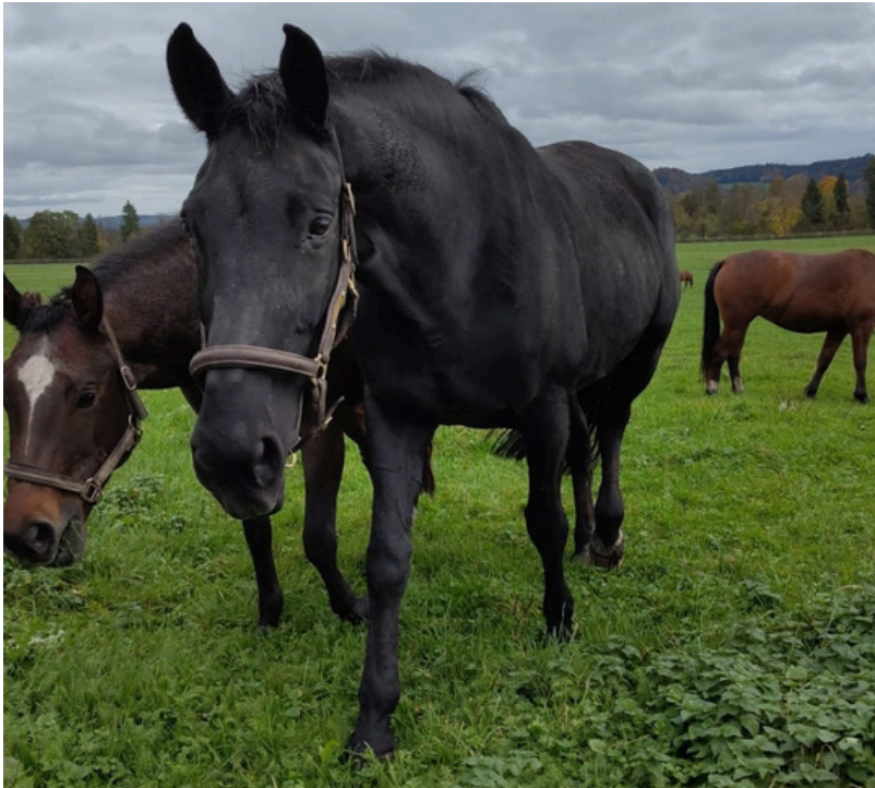
Refuge pour animaux de la prison de Wauwilermoos

Même les détenus se demandent « que ferait Jésus » ou quelles instructions, quels conseils utiles la Bible peut leur offrir pour mener une vie aussi irréprochable que possible après leur détention.