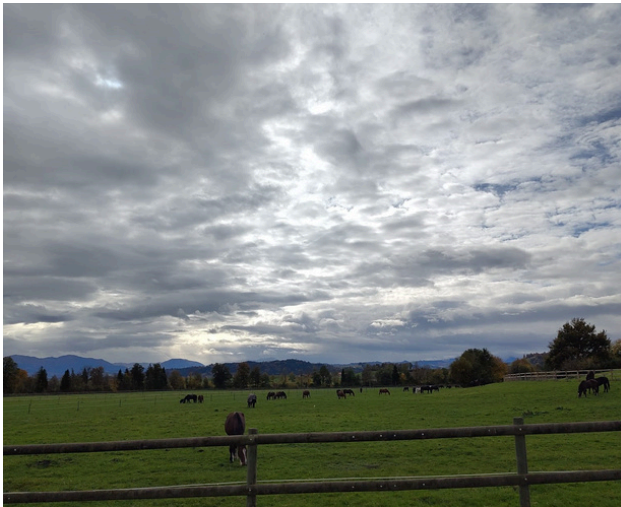
Exploitation agricole de la prison de Wauwilermoos, avec vue sur la région du Napf

Département de la justice, foyer Lindenfeld, Emmen : 14 places pour différents types de détention.