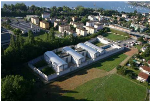
Prison de la Tuilière à Lonay